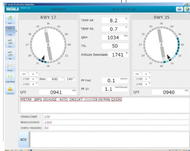
Tela da Estação Central

SISTEMA UTILIZADO EM AEROPORTOS ESTRATÉGICOS OU COM TRÁFEGO AÉREO REDUZIDO, AEROPORTOS DE CORUMBÁ, SANTOS DUMONT, VILHENA E EM DIVERSOS LOCAIS NO MUNDO.